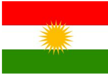
Figura 2 – bandeira do Curdistão

de altitude; possui ainda o lago Van com aproximadamente 12.000 km 2 e é atravessado pelos rios Tigre e Eufrates. É uma pretensa nação rica em água e petróleo.