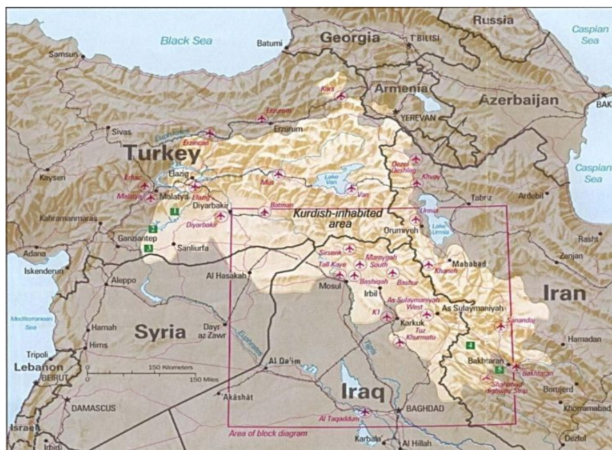
Figura 1 – área ocupada pela comunidade curda

Não se sabe ao certo quais os números reais da população curda, pois enquanto eles próprios exageram as estimativas, os governos dos países que eles habitam tendem a reduzir as mesmas; além de não ser possível contabilizar os muitos curdos que já foram assimilados pelas populações locais ou definir quais os subgrupos étnicos que pertencem ou não à etnia curda. A estimativa mais razoável dá conta de 12 a 15 milhões de curdos na Turquia (18% a 21% da população), 6 milhões no Irão (11% da população), 3.5 a 4 milhões no Iraque (20% a 23% da população), 800.000 na Síria (7% da população), 100.000 na antiga União Soviética, cerca de 1 milhão espalhados pela Europa e 20.000 nos EUA.